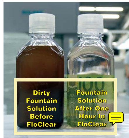
Soluzione di bagnatura prima e dopo il filtraggio

Eliminando la manutenzione e gli inconvenienti del sistema di bagnatura può far risparmiare 1 o 2 ore di fermo macchina alla settimana. Inoltre permettendo di estendere la vita della soluzione di bagnatura, si riducono enormemente i costi di smaltimento.